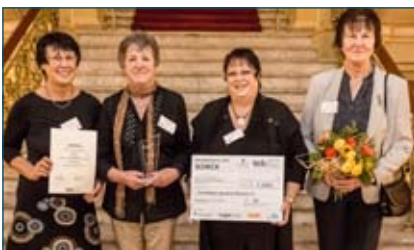
1. Platz: Leben mit Familienanschluss, Hansestadt Stendal (Freiwilligen-Agentur Altmark)

Das Jugendprojekt Genthin 2020 ist eine ehrenamtlich organisierte Projektgruppe, bestehend aus Jugendlichen und jungen Erwachsenen aus der Region Genthin im Jerichower Land. Mit den unterschiedlichen Veranstaltungen aus den Bereichen Berufsbildung und Arbeitsmarkt, Integration sowie Sport und Freizeit sollen sich Jugendliche mit ihrer Heimat identifizieren und sich aktiv an der Gestaltung beteiligen. Die Einheitsgemeinde Stadt Genthin sowie die Sekundarschulen und das Gymnasium unterstützen das Projekt.