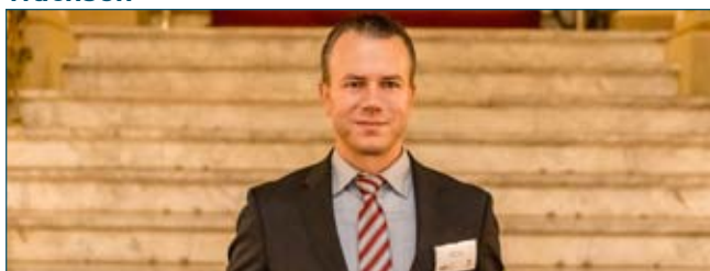
2. Platz: Kita-Bus – Beförderung von Kinder im Krippen- und Kindergartenalter aus der Ortschaft Osterburg (Hansestadt Osterburg, Altmark)