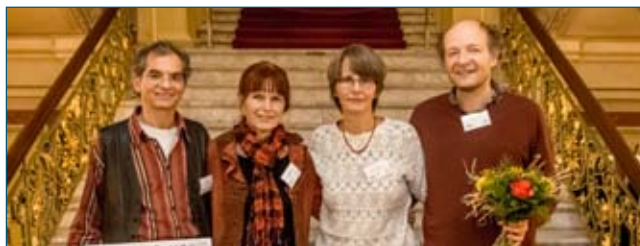
3. Platz: Ökodorf Sieben Linden, Beetzendorf (Siedlungsgenossenschaft Ökodorf eG)