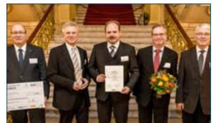
1. Platz: Schülergießerei Harz, Wernigerode (Lernstatt Wernigerode e.V.)