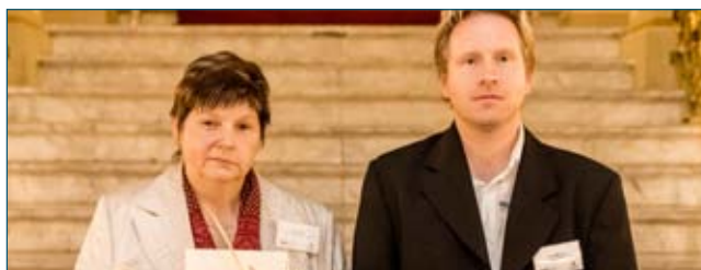
3. Platz: Wir e.V. – Landfrauen helfen sich selbst, Jessen