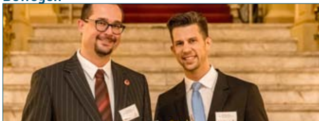
2. Platz: Innovatives Lehrkonzept der „Klasse Allgemeinmedizin“ zur Stärkung des hausärztlichen Nachwuchses, Halle (Martin-Luther-Universität Halle-Wittenberg, Medizinische Fakultät)