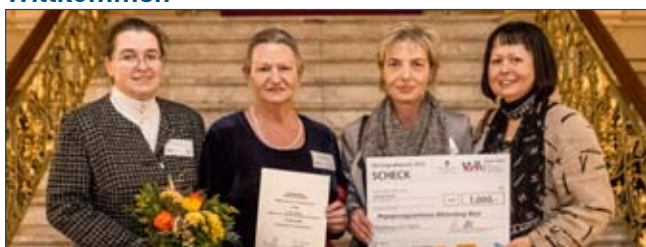
2. Platz: Sprachpaten für Flüchtlingsfamilien, Lutherstadt Wittenberg (Begegnungszentrum Wittenberg West)