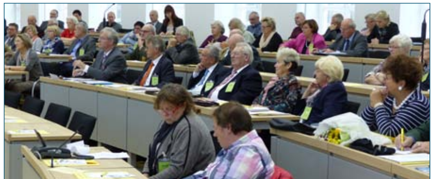
Sitzungsteilnehmer des 8. Landesseniorenforums

Am 22.09.2015 fand zum 8. Mal das Landesseniorenforum im Magdeburger Landtag statt, um gemeinsam über die Beteiligung aller Altersgruppen an der gesellschaftlichen Entwicklung zu