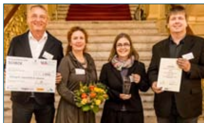
1. Platz: Mit Sieben-Meilen-Stiefeln um die Welt – Die Märchenjurte, Bernburg (Stiftung Ev. Jugendhilfe St. Johannis)