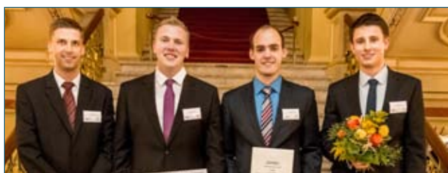
3. Platz: Jugendprojekt Genthin 2020, Genthin